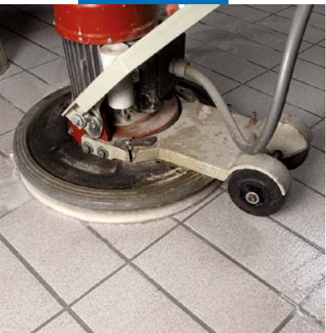
Очистка поверхности водой и дисковой машиной с абразивным падом, таким как "Scotch-Brite®"