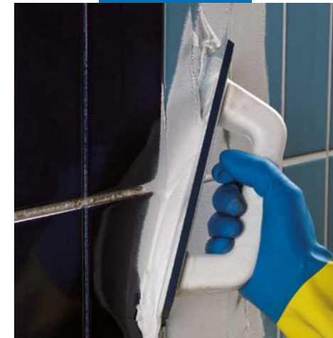
Нанесение Керапоху CQ на стены резиновым шпателем MAPEI

Плитка и отделочные материалы следует очистить после заполнения швов пока Керапоху CQ остаётся свежим, во всех случаях в пределах 60 минут после нанесения, даже если поверхность кажется чистой