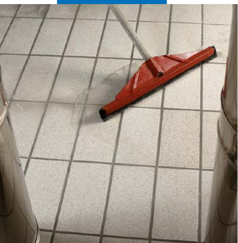
Удаление излишков воды резиновым скребком