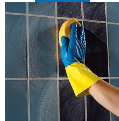
Окончательная очистка твердой целлюлозной губкой