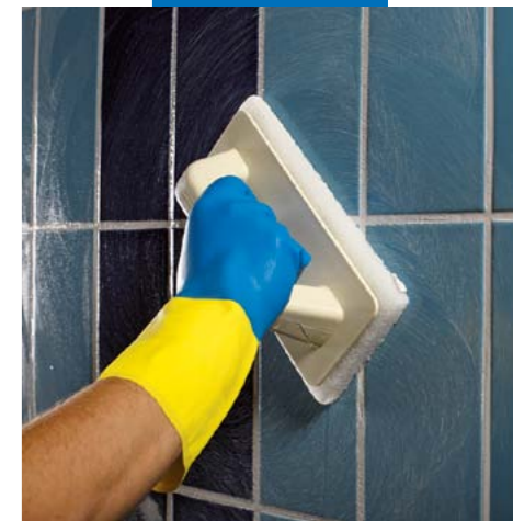
Удаление с поверхности излишки Керапоху CQ падом "Scotch-Brite®" с водой