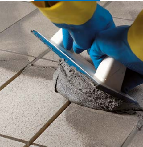
Нанесение Керапоху CQ резиновым шпателем MAPEI